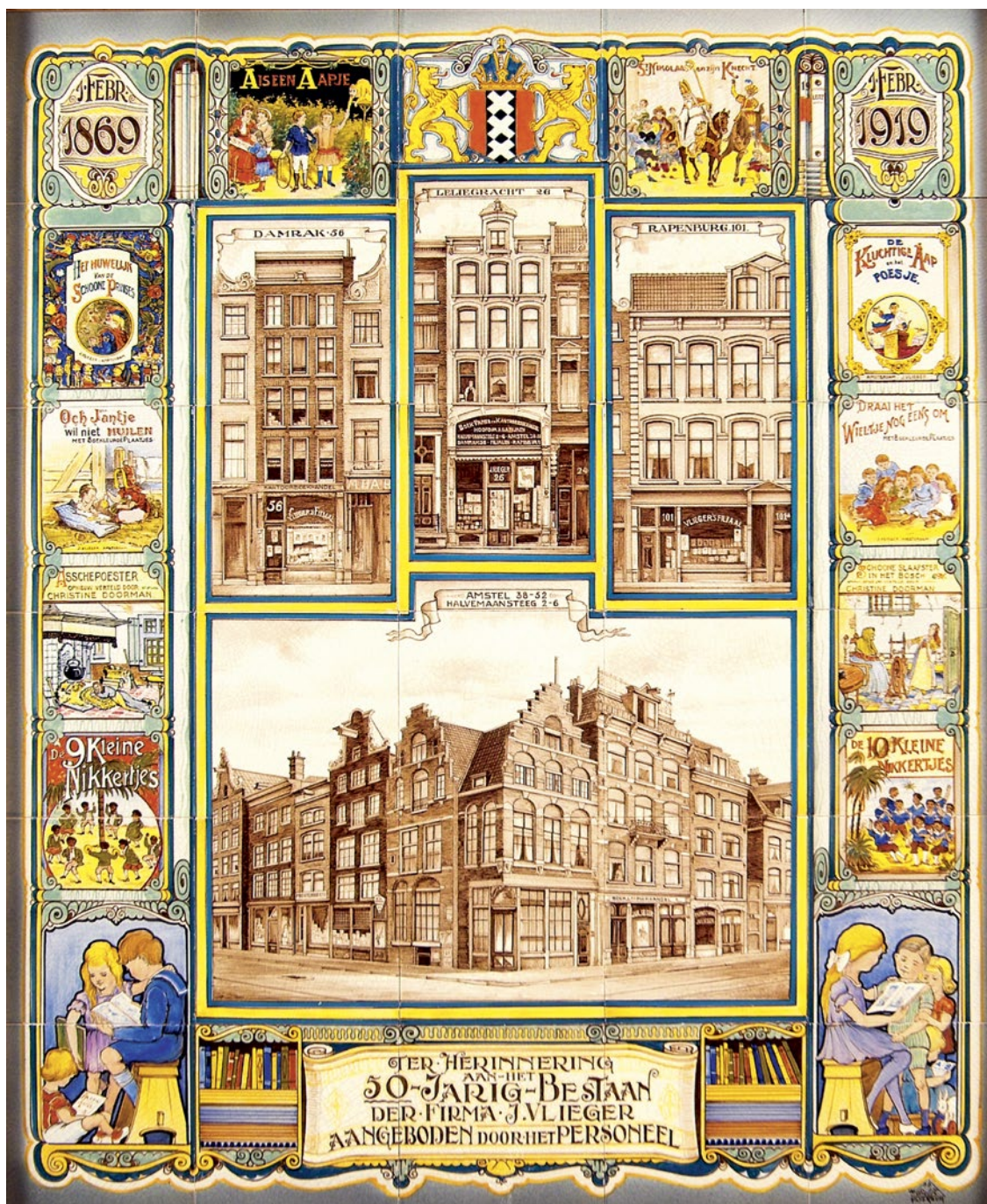
Tableau bij het jubileum van fa. Jan Vlieger in Amsterdam, door de Plaatelbakkerij Delft in Hilversum, 1919 | 106 x 90 cm | Objectnr. 08934 | Nederlands Tegelmuseum, Otterlo

onder 'De 10 kleine nikkertjes', gebaseerd op een Amerikaans aftelrijmpje uit 1868, en 'De 9 kleine nikkertjes', gebaseerd op een Engels spotdicht. Deze racistische en kwetsende rijmpjes waren tot ver in de twintigste eeuw populair als kinderlectuur.