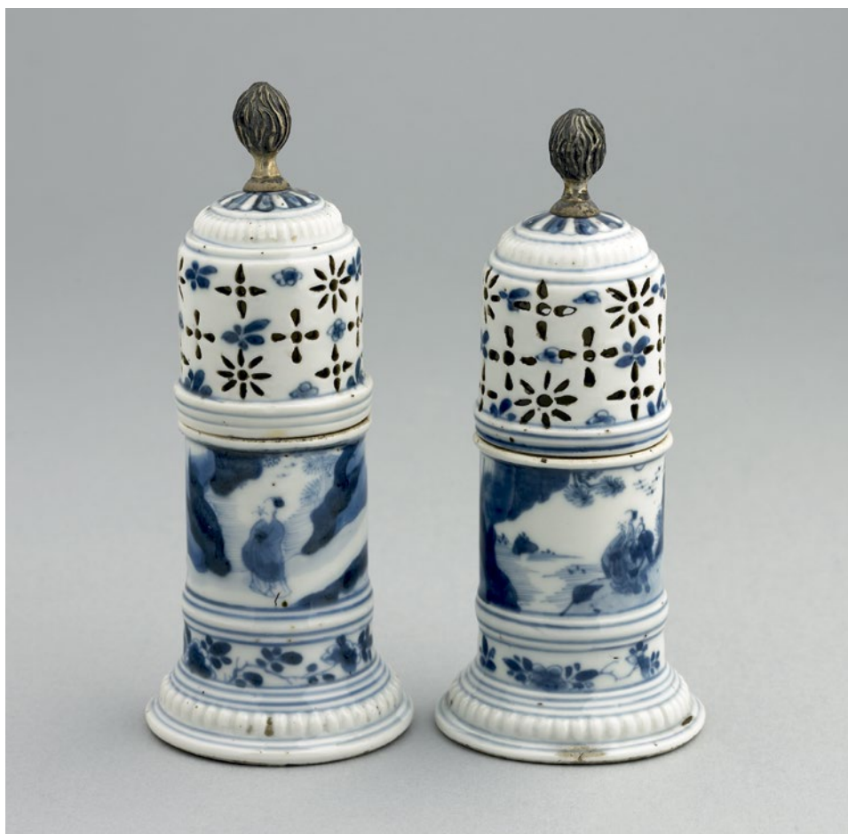
Anoniem, Suikerstrooiers , ca. 1700-1720 | Porselein, zilver, h. 17 cm | Objectnr. AB1573-A-B | Rijksdienst voor het Cultureel Erfgoed, in langdurig bruikleen bij Zeeuws Museum, Middelburg