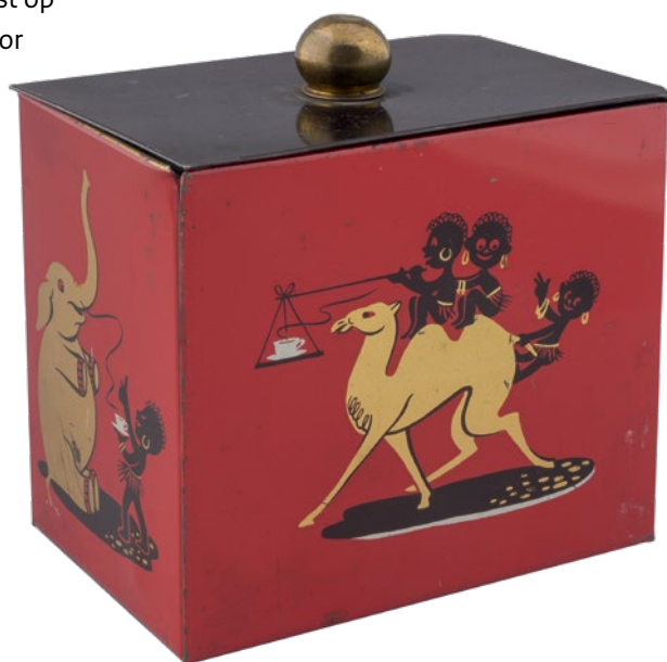
Koffieblik, 1950-1960 (?) | Blik, 13 x 12,5 x 7,5 cm | Objectnr. WM-600131

Ook objecten die in de twintigste eeuw vervaardigd zijn kunnen relevant zijn. Er zijn objecten waarop mensen afkomstig van een bepaalde etnische of raciale groep op stereotiepe en karikaturale wijze staan afgebeeld. Denk hierbij aan de manier waarop de oorspronkelijke bewoners van Noord-Amerika of zwarte mensen werden verbeeld in advertenties, op schilderijen of op gebruiksvoorwerpen. Voorbeelden hiervan zijn producten uit het dagelijks leven zoals koffieblikken, verpakkingen en kinderboeken. Allemaal hebben ze één ding gemeen: ze tonen mensen met stereotiepe en karikaturale gelaatstrekken en vaak in een onderdanige rol.