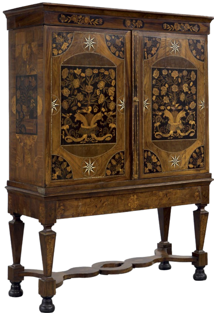
Kruisvoetkabinet , eind 17de eeuw | Tropische houtsoorten en ivoor, 145,5 x 55 x 193 cm | Objectnr. R4385 | Rijksdienst voor het Cultureel Erfgoed, Amersfoort

woord 'Eskimo' in te voeren. Deze term is echter nooit gebruikt door leden van de gemeenschappen zelf en wordt door hen negatief ervaren. De gevonden ongepaste termen kunnen worden aangepast in de collectieregistratie met behulp van bijvoorbeeld de publicatie Woorden doen ertoe , uitgegeven door het Nationaal Museum van Wereldculturen.